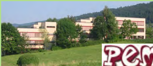
47. Ausgabe, im Juli 2018